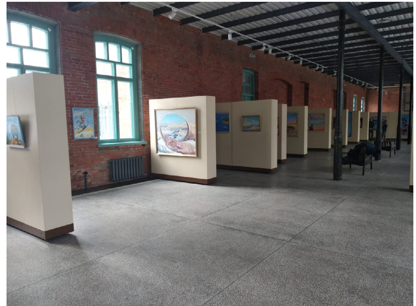
Интерьер Национального музея РСО-Алании